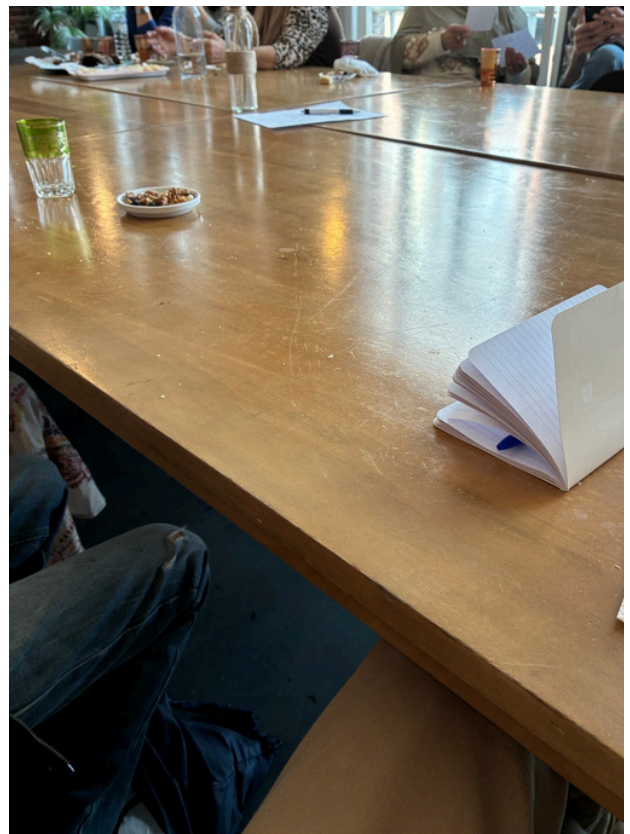
Réunion pour l'organisation de la fête des Voisins