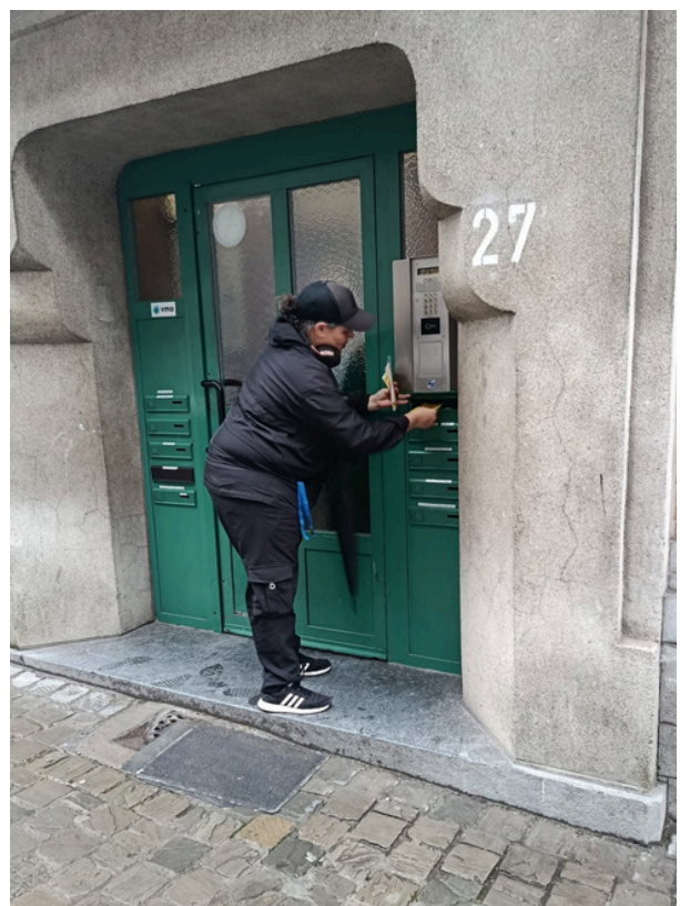
Distribution de flyers

Ces occasions permettent de créer des espaces de dialogue, de favoriser la compréhension mutuelle et de renforcer le sentiment d'appartenance au quartier. En développant ces initiatives, Pierre d'Angle contribue à promouvoir un meilleur vivre-ensemble.