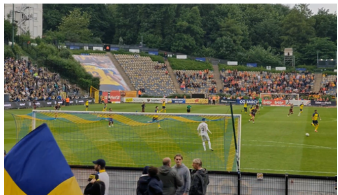
Match de l'Union du 10 mai 2026

Les usagers ont également la possibilité de prendre part à des tournois et de recevoir des tickets pour des matchs, dans une dynamique sportive conviviale et non compétitive. Dans ce cadre, plusieurs usagers ont notamment eu l'occasion d'assister à un match au cours du mois de mai dernier.